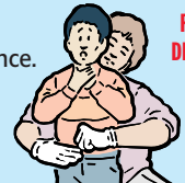
PLACEZ UN POING DANS L'AXE MÉDIAN DE L'ABDOMEN.