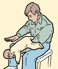
DONNEZ 5 TAPES VIGOUREUSES.

Si le bébé perd conscience, placez-le sur une surface ferme et plate et faites dépêcher des secours médicaux :