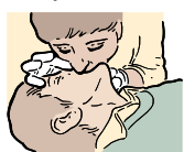
DONNEZ 2 INSUFFLATIONS