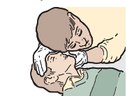
OUVREZ LES VOIES RESPIRATOIRES ET VÉRIFIEZ LA RESPIRATION