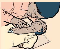
EXERCEZ 30 FORTES POUSSÉES ET DONNEZ 2 INSUFFLATION. RÉPÉTEZ JUSQU'À CE QUE LES SECOURS MÉDICAUX PRENNENT LA RELÈVE.