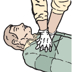
PLACER LES MAINS AU CENTRE DE LA POITRINE