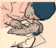
PLACEZ LE BOUT DE DEUX DOIGTS SUR LE STERNUM, JUSTE SOUS DES MAMELONS.