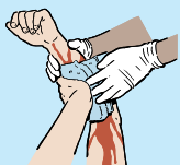
RÉPRIMEZ IMMÉDIATEMENT L'HÉMORRAGIE.