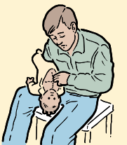
EXERCEZ 5 POUSSÉES THORACIQUES.