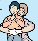
EXERCEZ DE FORTES POUSSÉES VERS L'INTÉRIEUR ET VERS LE HAUT.

Si l'enfant perd conscience, aidez-le tranquillement à s'allonger sur le sol et faites dépêcher des secours médicaux :