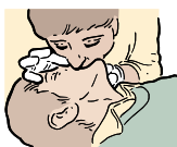
DONNEZ 2 INSUFFLATIONS