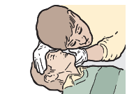
OUVREZ LES VOIES RESPIRATOIRES ET VÉRIFIEZ LA RESPIRATION