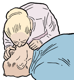
DÉ 2 RESPIRACIONES A LA VÍCTIMA