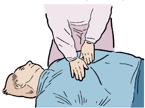
COLOQUE SUS MANOS EN EL CENTRO DEL PECHO