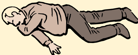
POSICIÓN DE RECUPERACIÓN

Consiga ayuda médica. Asegúrese que la persona esté respirando y luego colóquela en la posición de recuperación. Si la víctima no está respirando inicie RCP.