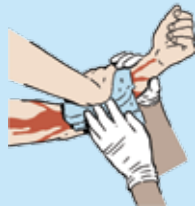
CONTROLE INMEDIATAMENTE LA HEMORRAGIA