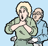
UBIQUE EL AREA SUPERIOR A LA CADERA