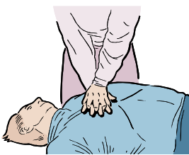
PRESIONE FIRMEMENTE 30 VECES Y LUEGO DE 2 RESPIRACIONES