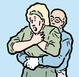
PRESIONE HACIA ADEENTRO Y ARRIBA

Si la persona se desmaya ayúdela (o) a recostarse en el suelo y envíe por ayuda médica