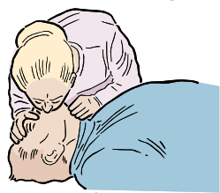
CONTINÚE RCP HASTA QUE LLEGUE LA AYUDA