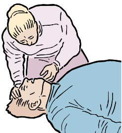
ABRA LA VIA RESPIRATORIA