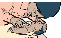
PRESIONE FIRMEMENTE 30 VECES Y LUEGO DE 2 RESPIRACIONES... REPITA HASTA QUE LLEGUE AYUDA