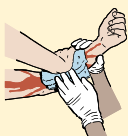
CONTROLE INMEDIATAMENTE LA HEMORRAGIA

Aplique inmediatamente presión sobre la herida utilizando vendas Mantenga a la víctima recostada