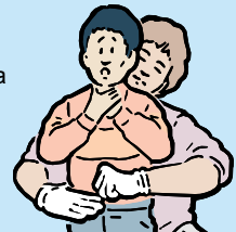
COLOQUE UN PUÑO AL MEDIO DEL ABDOMEN