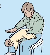
5 BACK BLOWS

Si el bebé se desmaya, colóquelo en una superficie plana y firme y envíe por ayuda médica.