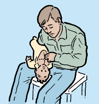
5 CHEST THRUSTS