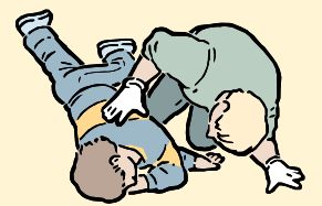
POSICIÓN DE RECUPERACIÓN

Consiga ayuda médica. Asegúrese que el niño (a) esté respirando y luego colóquelo (a) en la posición de recuperación. Si la víctima no está respirando inicie RCP.