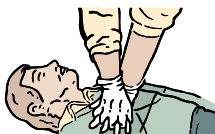
PRESIONE FIRMEMENTE 30 VECES Y LUEGO DE 2 RESPIRACIONES CONTÍNUE LOS CICLOS DE 30 COMPRESIONES Y 2 RESPIRACIONES HASTA QUE LLEGUE LA AYUDA