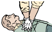
COLOQUE SUS MANOS EN EL CENTRO DEL PECHO VERIFIQUE SI RESPIRA