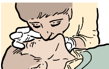
DÉ 2 RESPIRACIONES A LA VÍCTIMA