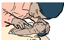
COLOQUE LAS PUNTAS DE LOS DEDOS EN EL PECHO DEL BEBE JUSTO DEBAJO DE LAS TETILLAS